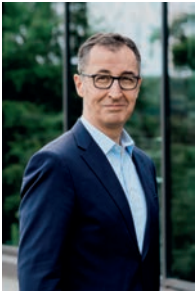
Bündnis 90 Die Grünen Cem Özdemir

Wirtschaftliche Ausrichtung: Er verbindet Transformation und Klimaschutz mit einem klaren Fokus auf wirtschaftliche Themen im Land und setzt auf ökologisch ökonomische Modernisierung.