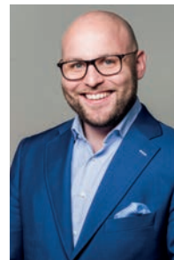
AfD Markus Frohnmaier